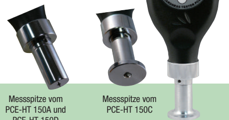
Messspitze vom PCE-HT 150A und PCE-HT 150D